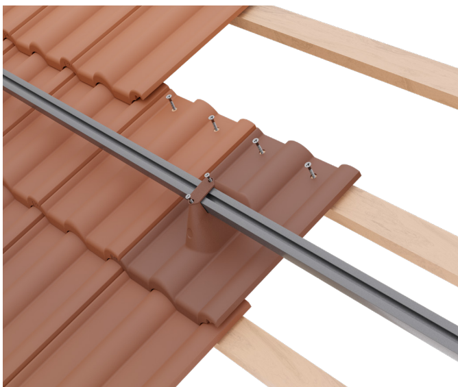
K laťování je vždy nutné sešroubovat tašku s konzolí a také tašku zleva. Pokud nebude mít původní taška montážní otvor, tak použít vichrovou sponu.