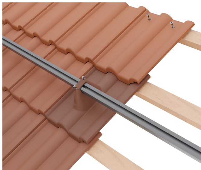
Zároveň šroubujeme původní střešní tašku, která překrývá tašku s konzolí z vrchu. Pokud nebude mít původní taška montážní otvor, tak použít vichrovou sponu.